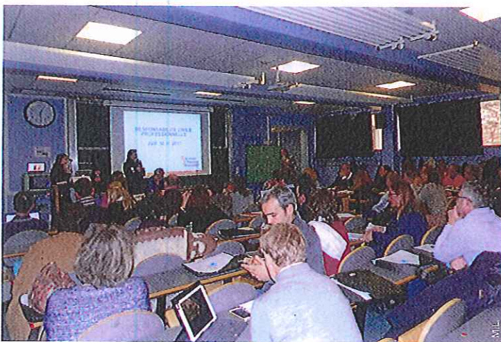
Une trentaine de vétérinaires a assisté à la Journée des vétérinaires d'Ile-de-France.